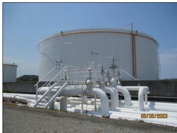
ถังเก็บน้ำมันภายในพื้นที่โครงการ