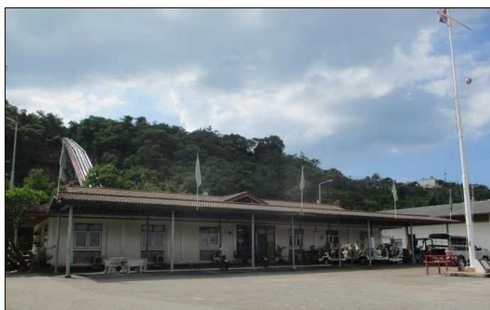
อาคารสำนักงานและท่าเทียบเรือ